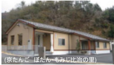
(京たんご ぼたん もみじ比治の里)

平成 20 年 12 月には京都府の交付金支援を受け、南丹市に、地元の猟師が自ら捕獲した鹿を、食肉として出荷するための解体作業を行う施設が設置された。ここでは年間 100～200 頭の解体、精肉が行われている。