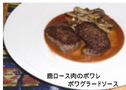
鹿ロース肉のポワレ ポワグラードソース

しかし、鹿肉は 5 月から 7 月が脂の乗る最もおいしい時期だという。このため、京都ではジビエ食材に詳しいシェフは夏にもジビエ料理を提供しているというが、これには別の理由もある。