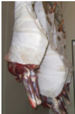
内臓摘出、皮はぎ後、低温で熟成(比治の里)

今まで流通していなかった鹿肉を流通させるルートの開拓は困難であるが、ゆっくりと進んでいる。京都府や南丹市が中心となった美山鹿肉キャンペーンが 3 箇年にわたって繰り広げられたほか、放送局と連携して販売した「鹿カレー」は、初年度分は完売する人気となった。京丹後市では、施設の設置により流通する流れができたということで、地元の旅館やレストランなどでジビエ料理を提供し、地元の特産品として土産物店に並べるほか、市外の日本料理店、フランス料理店、調理師専門学校などへの出荷も行われており、販路の広がりが見られつつある。