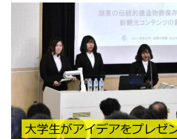
大学生がアイデアをプレゼン

➡ 学生のアイデアを広く知ってもらい、それを 事業化 するため、 地域事業者と学生が具体的な取組方法を検討する企画 を提案。