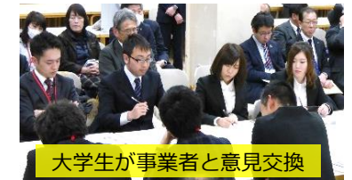
大学生が事業者と意見交換