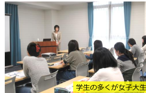
学生の多くが女子大生