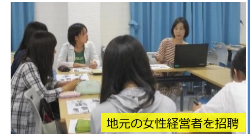
地元の女性経営者を招聘