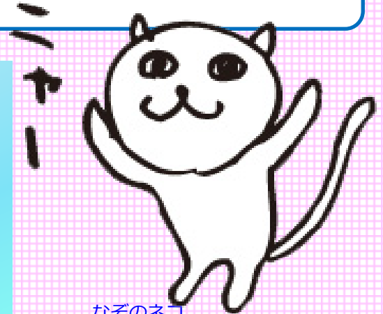
なそのネコ