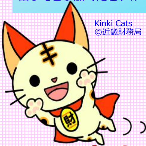
Kinki Cats